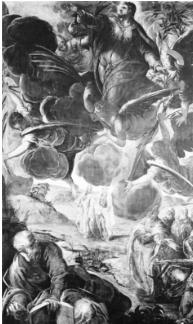
Jacopo Tintoretto: Christi Himmelfahrt , 1576–1581 (Scuola di San Rocco, Venedig)