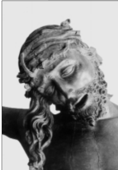
Veit Stoß: Kreuzifix auf dem Hochaltar (Ausschnitt), 1516–1520 (St.-Lorenz-Kirche, Nürnberg)

Das Unbehagen, das uns heute beim Lesen der Passionsberichte an den entsprechenden Stellen überfällt, verschwindet nicht, wenn wir die Bachsche Vertonung der Johannes-Version hören. Die »antijudaistischen Affekte« des Textes schwächt der Komponist nicht ab. Im Gegenteil: Der »den Juden« bei der Forderung des Todes Jesu unterstellte blinde Eifer, Spott und Hass wird musikalisch krass auskomponiert – so krass sogar, dass äußerst modern wirkende Klangflächenkompositionen entstehen. Peter Schleuning hat in seinem Essay über den Hass in der Musik in Bezug auf die Vertonung der Kreuzigerrufe von den »wunderbaren und wüst verzerrten Chören unversöhnlichen Hasses«, von »extremen rhythmischen Zusammenballungen und schneidenden Dissonanzen« und von »stechenden In-