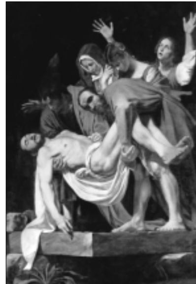
Michelangelo Caravaggio: Grablegung Christi , 1602–1604 (Pinacoteca Vaticana, Rom)